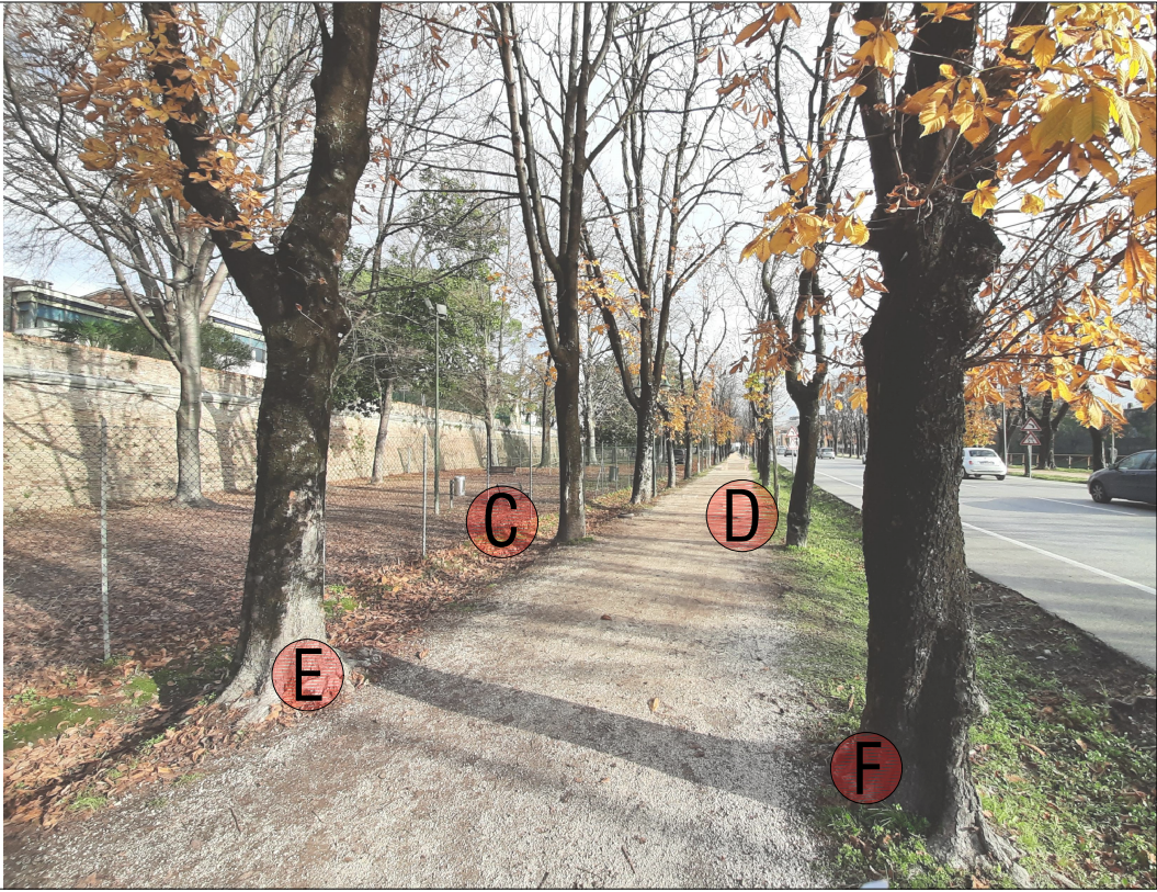
ESSENZE ARBOREE E, F, G, H