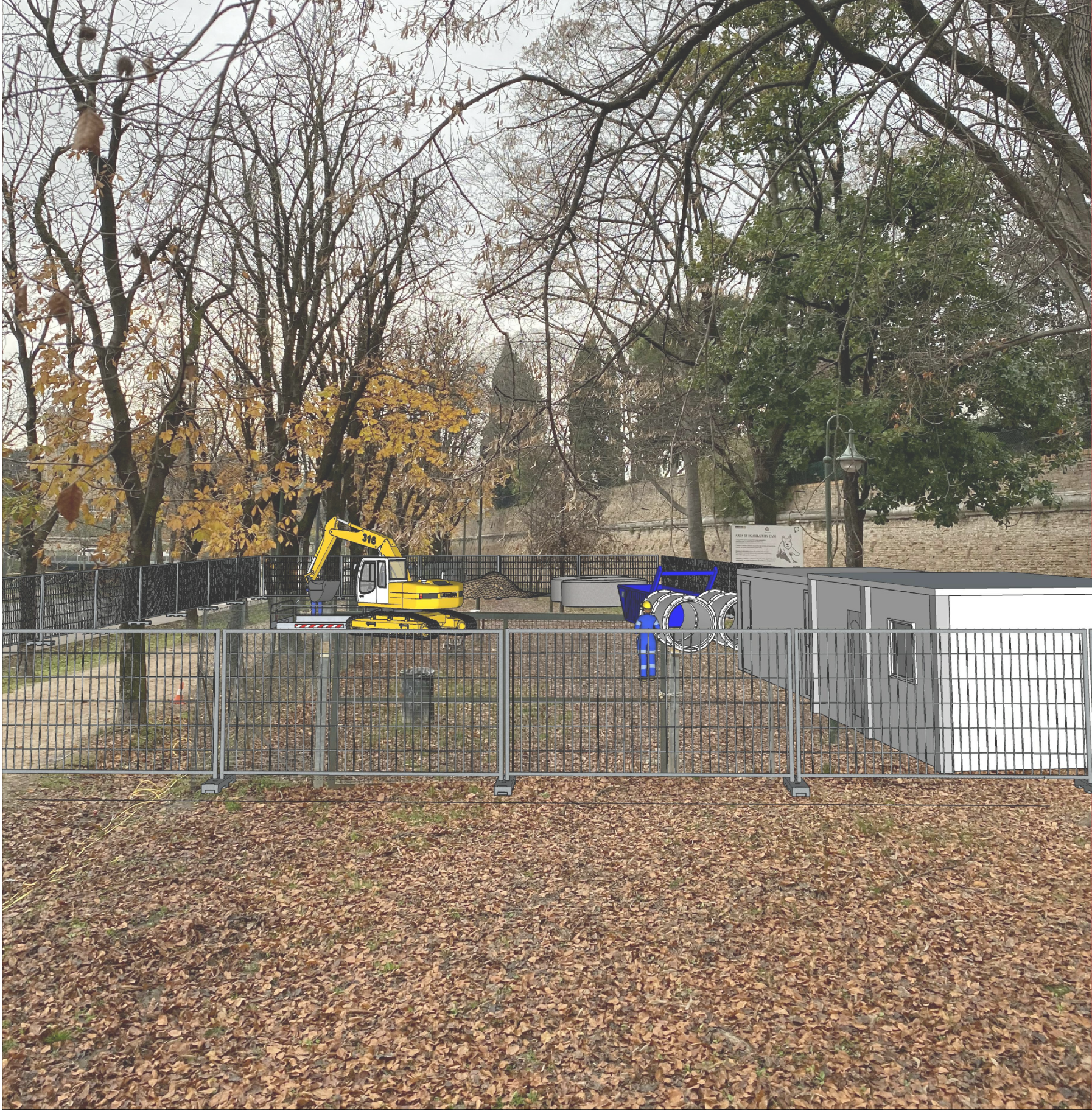
FOTOINSERIMENTO TRIDIMENSIONALE - POZZETTO DI ARRIVO 3a